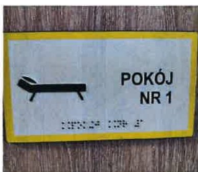
Wymiar 200mm x100mm