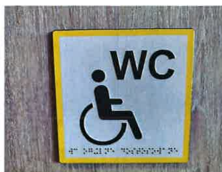
Wymiar 150 mm x150 150mm